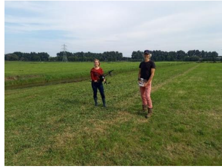
Dronevliegers van RVV

Na de bijeenkomst konden de aanwezigen twee besdragende planten meenemen. De in totaal 200 vuur- en sleedoorns zijn inmiddels uitgedeeld en zullen op de erven bijdragen aan vergroting van de biodiversiteit.